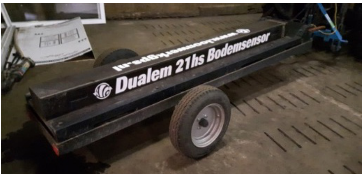
Figuur 1. Dualem bodemsensor

Een geleidbaarheidsscanner maakt scans van de EC-waarden op verschillende diepten in de bodem terwijl je eroverheen rijdt met de scanner. Op schrale ondergronden zoals zandgrond wordt geadviseerd om op 1,5 meter diepte te scannen omdat deze bodems een lagere geleidbaarheid hebben.