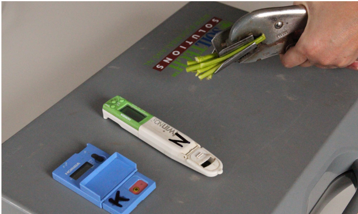
Figuur 3. Als vervolgstap op de spectraalbeelden kan met behulp van plantsapmonsters verder worden nagegaan waar het gewas behoefte aan heeft op specifieke locaties in het perceel.