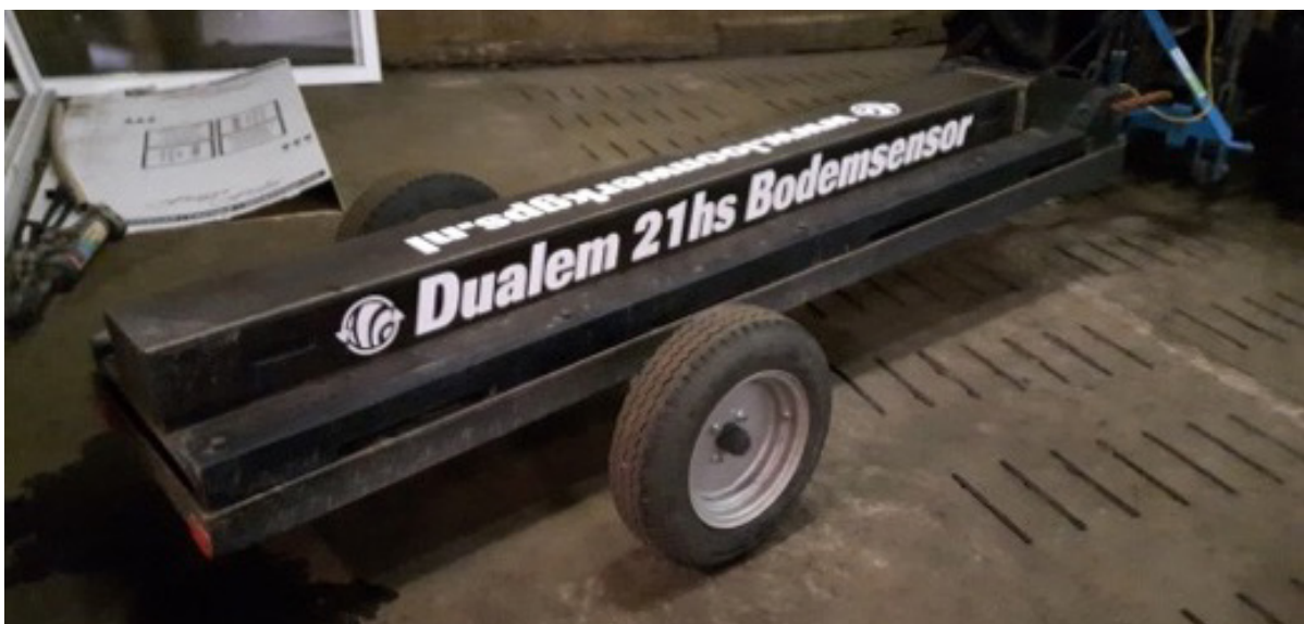
Figuur 1. Dualem bodemsensor

Een geleidbaarheidsscanner maakt scans van de EC-waarden op verschillende diepten in de bodem terwijl je eroverheen rijdt met de scanner. Op schrale ondergronden zoals zandgrond wordt geadviseerd om op 1,5 meter diepte te scannen omdat deze bodems een lagere geleidbaarheid hebben.