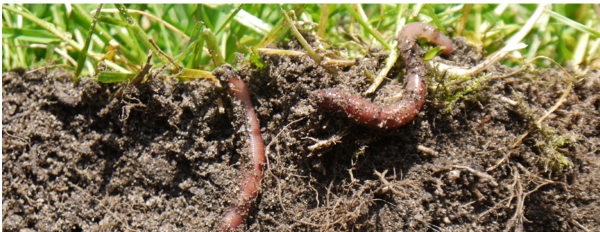
Figuur 3. Een gezonde bodem heeft een goede organische stofbalans, de voedingsbasis voor het bodemleven. Bodemleven draagt bij aan een goede doorwortelbaarheid en voeding voor het gewas.

Draag zorg voor een goede en gezonde bodemkwaliteit want dit bevordert de nutriëntenbenutting. Zorg naast een optimale pH 1 voor een goede bodemstructuur zonder storende lagen en een lage druk van bodemziekten en -plagen door een gezonde vruchtwisseling. Dit bevordert de beworteling van het gewas. Een slechte beworteling leidt doorgaans tot een verminderde benutting van stikstof en fosfaat, resulterend in een lagere opbrengst t.o.v. de kosten. Het belang van een goede vruchtwisseling wordt doorgaans onderschat. Aardappelen bijvoorbeeld dienen aan het eind geleidelijk in loof te verkleuren voor het behalen van de hoogste opbrengst. In een gewas dat onregelmatig afsterft moet de oorzaak worden gezocht in aaltjesschade en niet, zoals vaak wordt gedacht, in een te lage bemesting.