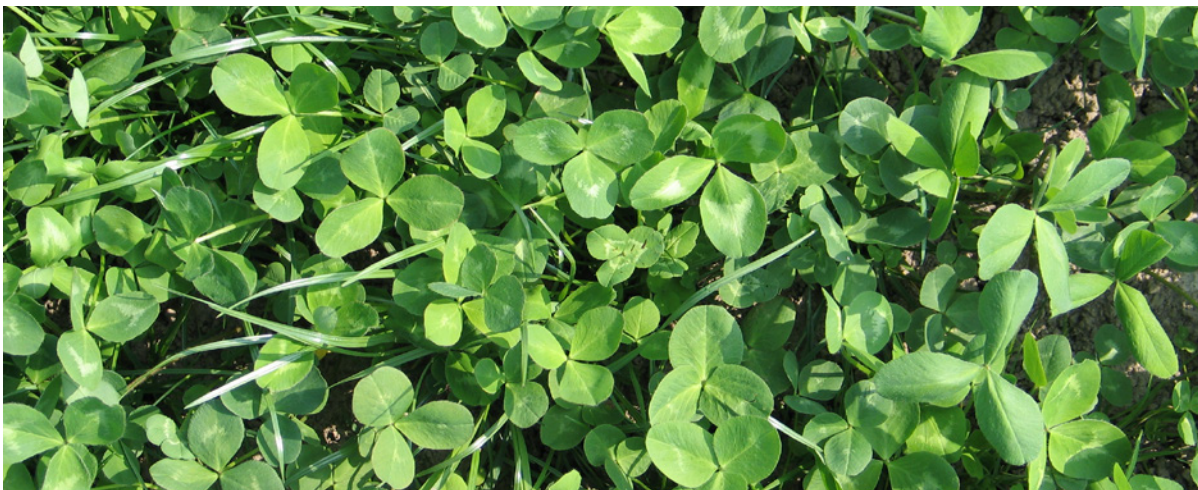
Figuur 1. Vlinderbloemige groenbemesters zoals klaver zorgen voor externe input van stikstof doordat zij stikstof kunnen binden uit de lucht

Een groenbemester heeft mineralen nodig om te kunnen groeien. Houd bij de bemesting van een groenbemester rekening met de hoeveelheid reststikstof na de oogst van het hoofdgewas. Naast stikstofbinding hebben groenbemesters nog meer voordelen zoals een mogelijke aaltjes reducerende werking, organische stofaanvoer, erosiebeperking (wind en water) en verbetering van de bodemstructuur.